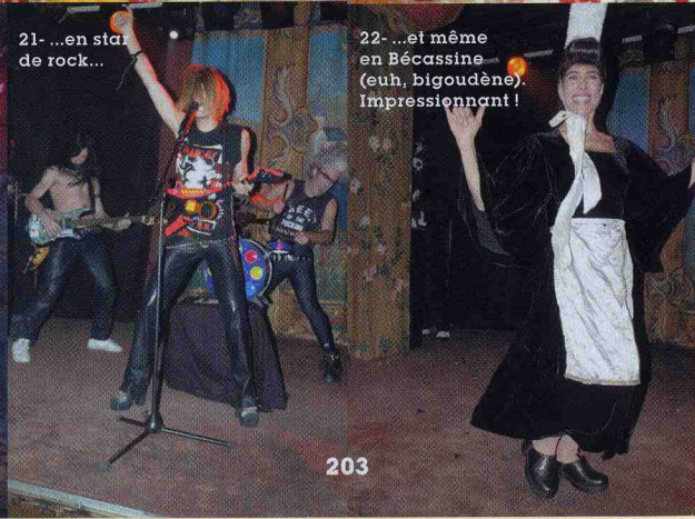
22- ...et même en Bécassine (euh, bigoudène). Impressionnant !